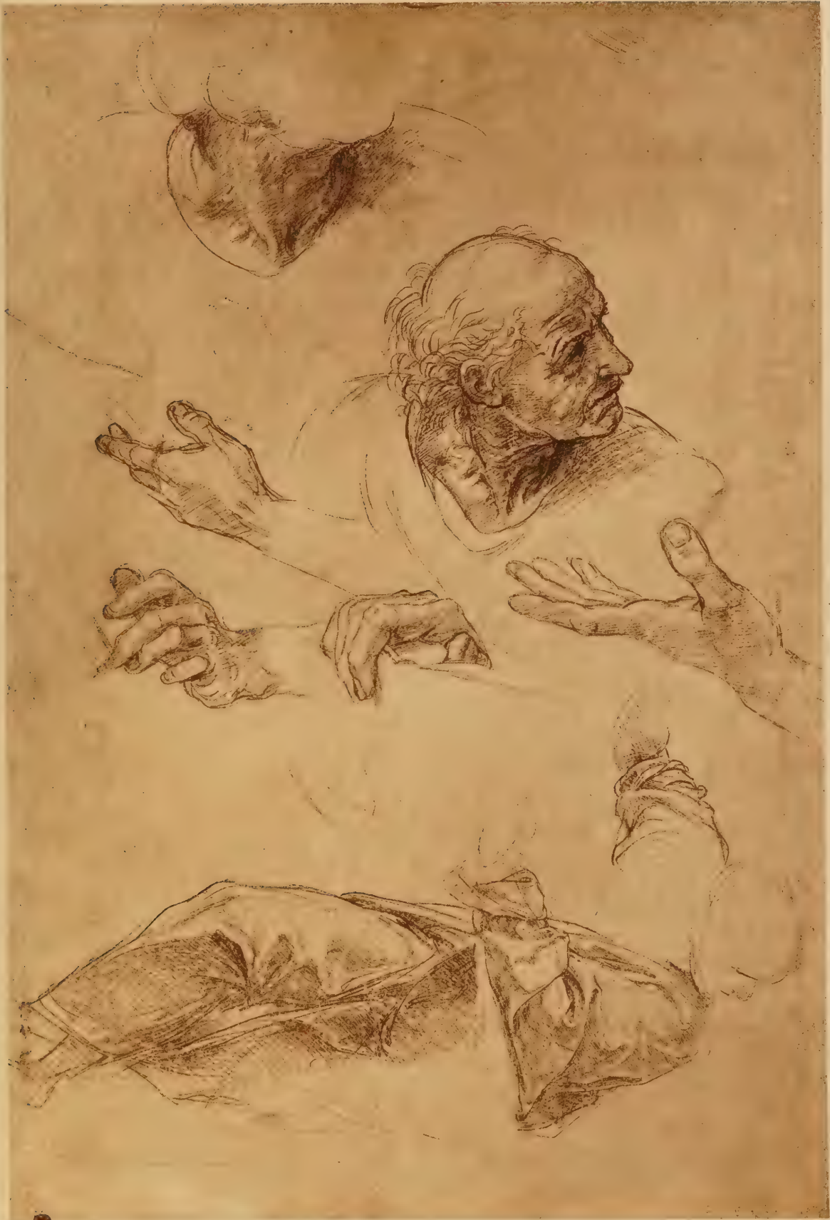
Etude pour la Dispute du Saint-Sacrement